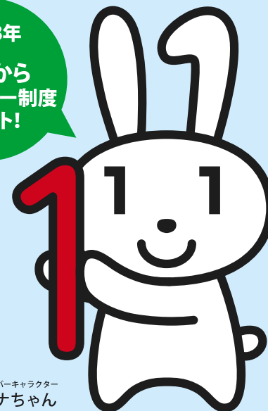
マイナンバーキャラクター マイナちゃん